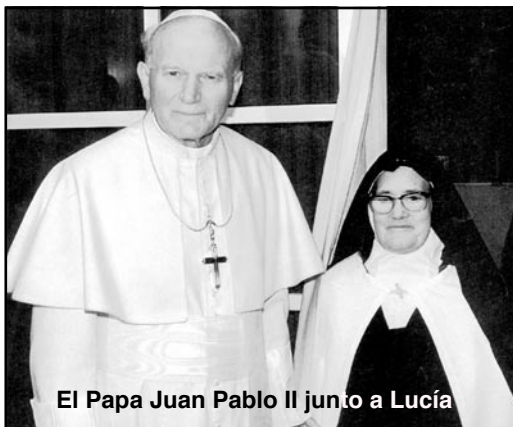
El Papa Juan Pablo II junto a Lucía

A no tener en cuenta esta revelación privada.